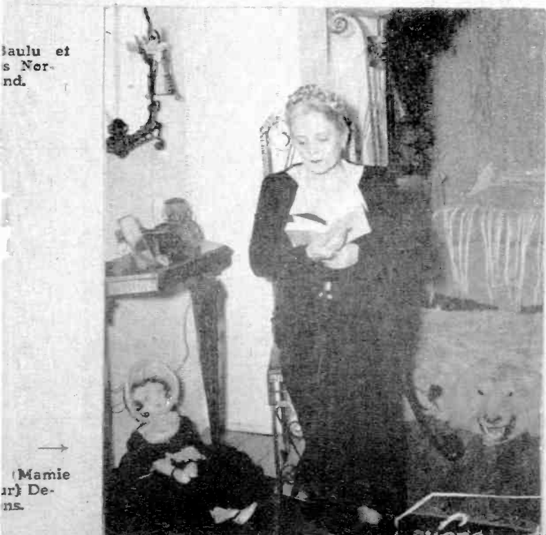
Baulu et s Nornd.